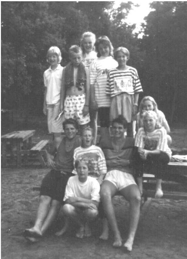
Schoolkamp 1989 De Wegwijzer

Bestuur van harte gelukkigwens met jullie jubileum en ik hoop, "Wegwijzer", dat jullie de 100 ook halen.