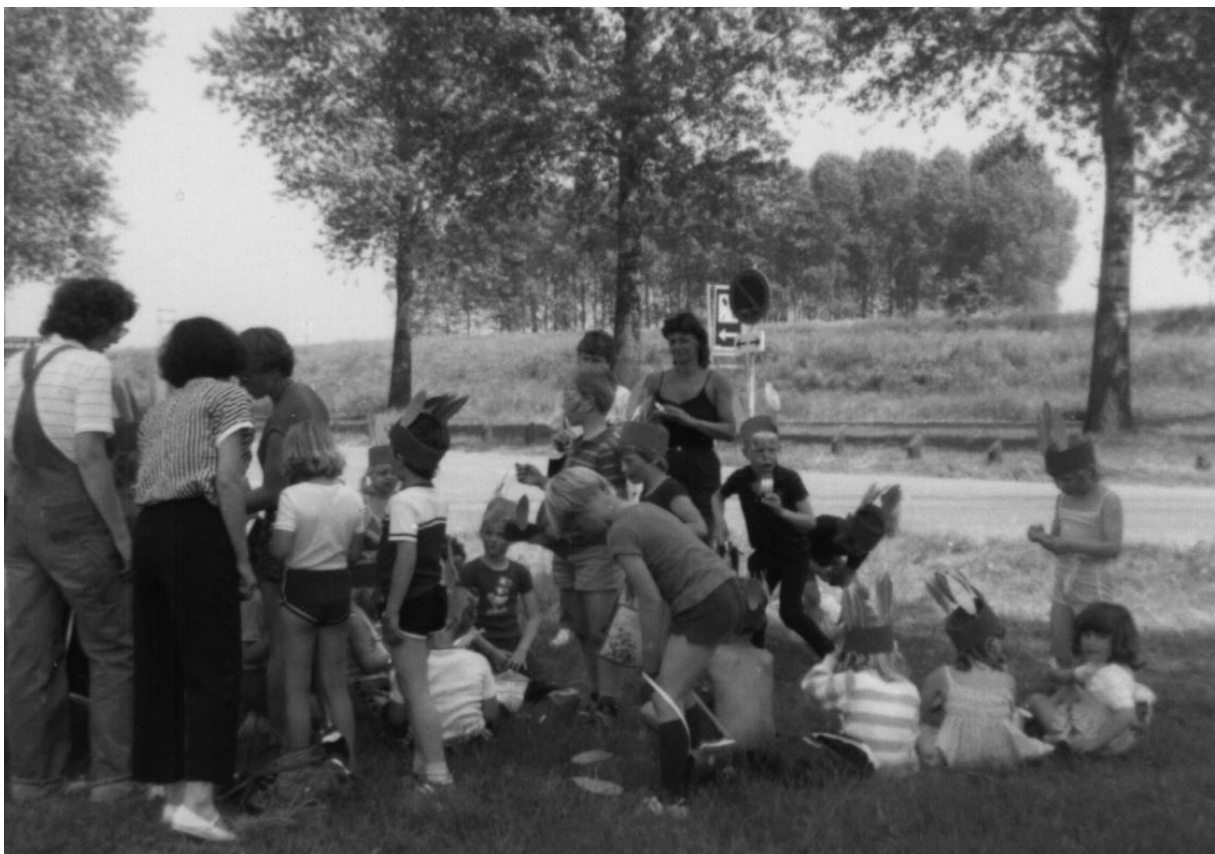
De Wegwijzer Indianendag bij Nulde 1984

Met vallen en weer opstaan hebben wij getracht om 16 jaar ons in te zetten voor de vereniging en haar doelstelling. Aan dit belangrijke deel van ons leven bewaar ik heel fijne herinneringen.