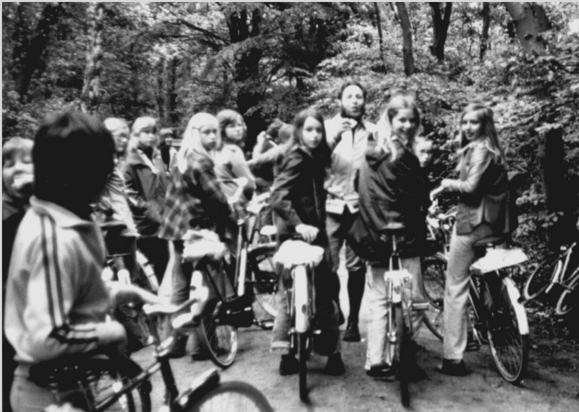
Da Costaschool op kamp 1975

Daar heb ik het volste vertrouwen in. Laten we met z'n allen zorgen, dat er voor die ouders die hun kind bewust op een Christelijke school met een CNS op GG signatuur willen plaatsen, altijd een gelegenheid is om dat te doen. We kunnen dat bevorderen door ons actief in te zetten voor de scholen waar onze kinderen op zitten.