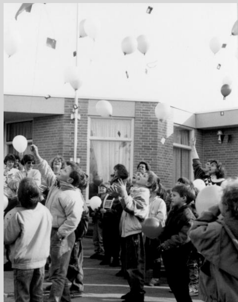
Opening School Hoef 1990

De grote kinderen maakten samen stenen mozaïeken en nog steeds ligt dit metselwerk in ons schoolplein. De jongsten metselden de eerste steen, gemaakt naar een ontwerp van een kleutertekening.